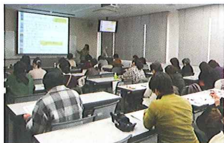
ブラッシュアップ講座の様子