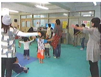
奈良こども館での保育体験の様子